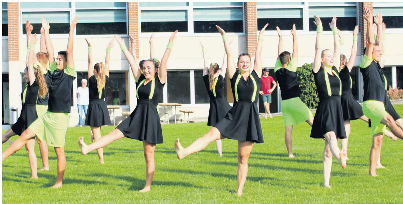
Am Regionaltturnfest gibt es nicht nur spannende Wettkämpfe zu erleben.

Am Freitag, um 14 Uhr, beginnen die Vereins-Wettkämpfe und werden am Samstag von 8 bis zirka 18 Uhr weitergeführt. Hier haben sich rund 230 Vereine, vorwiegend