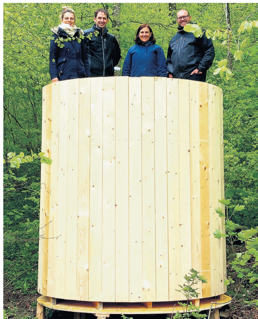
Das Nest der Elfenkönigin wurde inspiziert.

Die Bühne für den «Sommernachtstraum» ist bereit